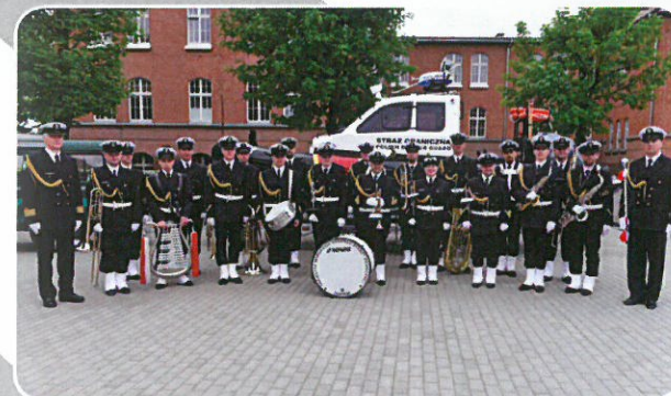
Orkiestra Morskiego Oddziału Straży Granicznej.