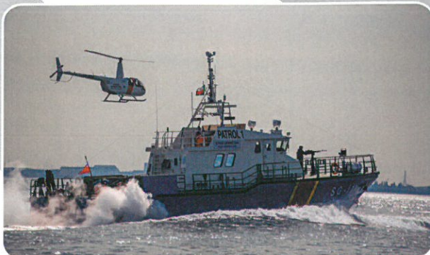
Jednostka pływająca SG-111 typu Patrol 240 Baltic.