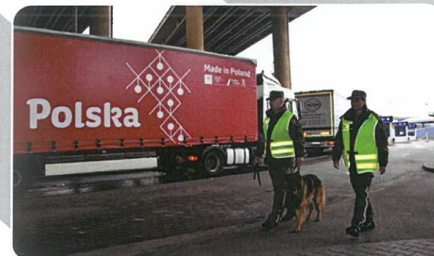
Funkcjonariusze patrolują terminal promowy w Gdyni z wykorzystaniem psa służbowego.