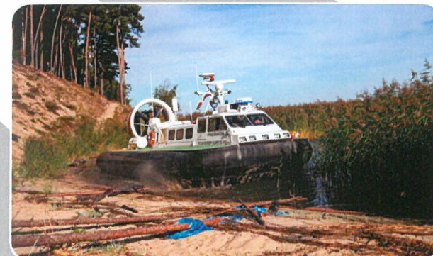
Poduszkiwiec SG-411 typu GRIFFON 2000 TD MK III.