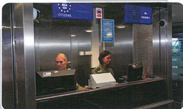
Funkcjonariuszki podczas odprawy granicznej na lotnisku w Gdańsku.